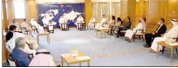
وزير الخارجية مستقبلاً كتاب الرأي

وأكد وزير الخارجية أن الأوضاع المتساوية في عدد من الدول العربية تحتاج إلى نهج جديد للتعايش معها، نهج يساعد على إعادة الأمن والاستقرار والسلام إلى المنطقة، ويعطي للشعوب أملاً في مستقبل أفضل. من جانبهم، أشاد كتاب الرأي في الصحافة المحلية بالدور الهام والخطوة التاريخية الشجاعة التي اتخذتها مملكة البحرين من خلال التوقيع على إعلان تأييد السلام بينها وبين دولة إسرائيل، منوهين بالجهود الكبيرة التي تضطلع بها المملكة من أجل تحقيق الأمن والسلام والاستقرار في المنطقة، متمنين لمملكة البحرين مزيداً من الإنجازات الملموسة في كل ما من شأنه خدمة الوطن والمواطن.