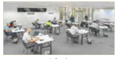
جانب من الدورة

تضمنت موضوعات تفصيلية وتدريبات ميدانية للتعامل مع التحديات الراهنة