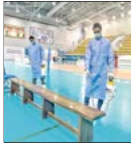
تعميم الصالات واللاعب

الإفصاح عن حالات المخالطة للاعبين المنتخبين واجب ديني ووطني وإنساني الرياضيون قادرين بالوعي والالتزام على مواجهة الجائحة ومواصلة الإنجازات