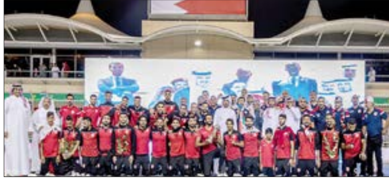
بالانضمام والبرعي ستعود الإنجازات الرياضية

خاتمة الرّؤى، دعونا نتطلع جميعاً إلى انتخابات الاتحادات الرياضية القادمة بتقاول على الرغم من الظرف الاستثنائي الذي يعيشه وسطنا الرياضي جراء (كوفيد 19). إن الواقع ومصحلة الرياضة البحرينية يدعوان لاستقطاب الكفاءات وأهل الخبرة وأصحاب الشهادات والمؤهلات لقيادة دفة العمل في المرحلة القادمة خاصة وأن الرياضة أصبحت علماً وصناعة ويجب أن تتعامل معها من هذا المنطلق العلمي، وأن يكون هذا شعاراً للمرحلة الرياضية القادمة بما يحمله من مضامين ودلالات عظيمة. حياة تستمر.. رؤى لا تغيب