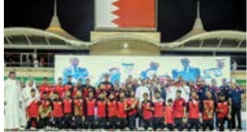
○ يجري والالتزام بتعدّد الإجراءات الرياضية.

● الإفصاح عن حالات المخالطة للاعبين المنتخبات واجب ديني و وطني وإنساني ● الرياضيون قادرون بالوعي والالتزام على مواجهة الجائحة ومواصله الإنجازات