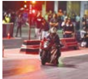
○ جانب من منافسات التراجيات التارية