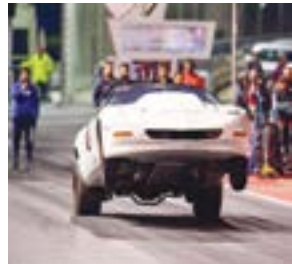
○ جانب من منافسات السيارات

منوها باسمه وثانية من إخوانه السري في مجلس إدارة النادي وفي اللجان العاملة بخاصة السكر والتقدير والإسهام إلى رئيس الاتحاد البحريني للسيارات الشيخ عبدالله بن عيسى آل خليفة والرياسة التنفيذية لخدمة البحرين الدولية الشيخ سلمان بن عيسى آل خليفة مقربين لهم اهتمامهم و دعمهم لهذه الأنشطة الرياضية، كما خص بالشكر مدير الاتحاد البحريني للسيارات عبدالعزيز النضوي، ممثلاً لجهود في دعم البطولة وأنشطة النادي. والجدير بذكره أن الاتحاد البحريني للسيارات أصدر رزمة الموسم الجديد ٢٠٢١/٢٠٢٠ وتتضمن إقامته العديد من السباقات الوطنية والمطولات الإقليمية والدولية، في طبيعتها